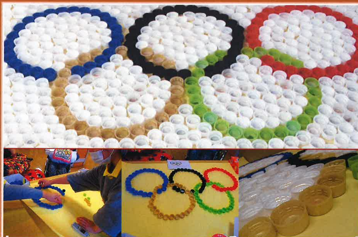
【 壱番館 通所生活介護ご利用者作：～オリンピック～ 】