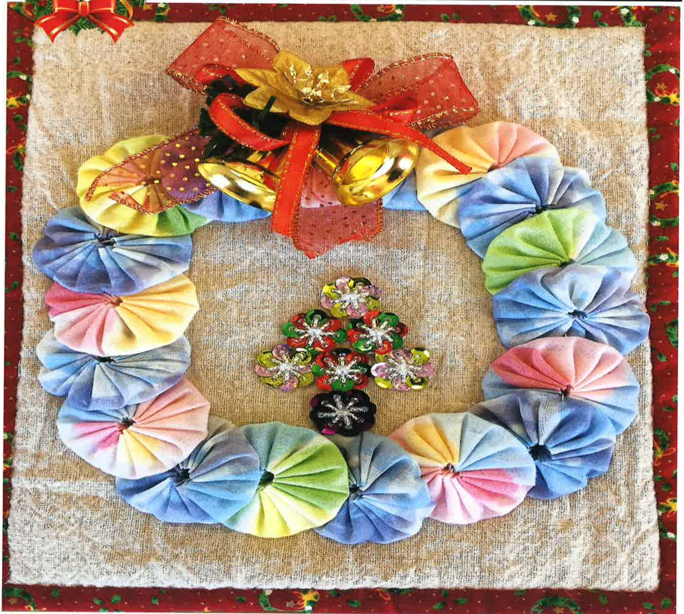
クリスマスリース